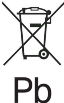
Figuur 2 – Voorbeeld van markering met symbool voor gescheiden inzameling volgens bijlage VI, deel B, en met het chemische symbool "Pb" voor het gehalte aan zware metalen Pb volgens artikelen 13.4 en 13.5